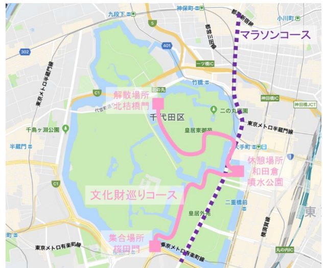
実線：文化財巡りコース 点線：2020東京オリ・パラのマラソンコース